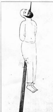
Miniature paintings showing Ottoman punishments.