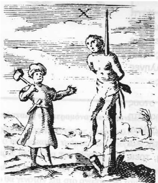
Resim 2: Istoria tis Kyprou , Gymnasio , (Lefkoşa, 2005), s. 105.

Other members of the divan might include the vizier for finance, the aga (commander) of the janissaries and the grand admiral. This group discussed the advice they would give the sultan; the divan also acted as the highest court in the Ottoman Empire.